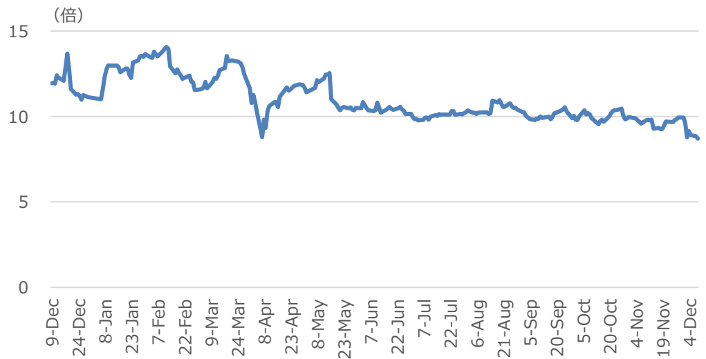
図表 5. 過去 1 年間の PER 推移

同社の PER は 10 倍を下回っており、バリュエーションはヒストリカルでも最低水準で推移している。ふるさと納税事業の成長鈍化及び規制強化に対する懸念や、買収した M&A 仲介事業やセキュリティ事業等の成長を示せていないことが背景にある。加えて、12 月 2 日の日本経済新聞で、ふるさと納税によって受けられる税金の控除額に上限が設けられる可能性があると報じられた（12 月 10 日には、年収が 1 億円相当以上ある人に対して、控除額の上限が設けられる案が浮上）ことも、一段と株価を押し下げた。